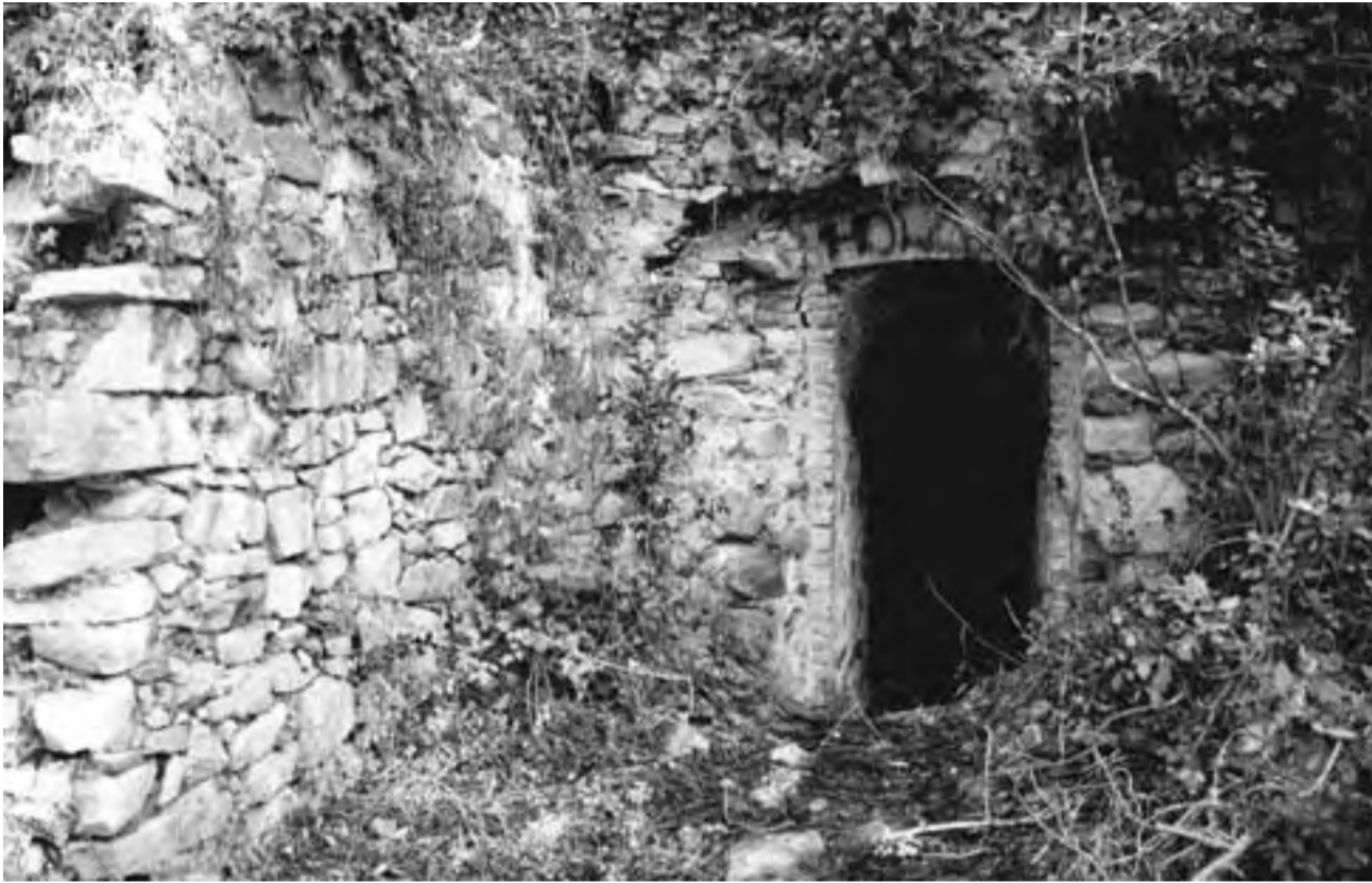
Entrada de l'amagatall de Ca l'Alzina Vell.