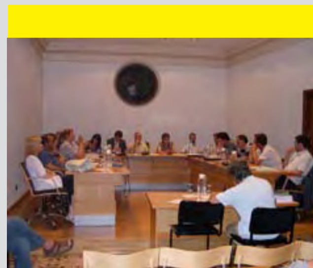
Moment del passat ple quan la CUP presenta la moció sobre els desnonaments.

Malgrat l'aprovació per unanimitat de la moció, el grup de CiU segueix sense portar a terme l'augment de l'IBI que s'hauria d'aplicar als pisos buits, una mesura que ajudaria a facilitar l'accés a l'habitatge.