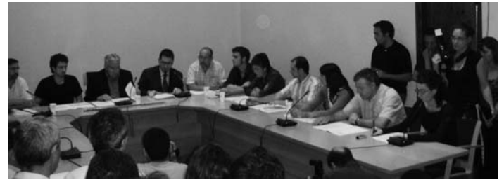
Constitució del ple de l'Ajuntament sorgit de les darreres eleccions municipals

Aquestes són, doncs, algunes de les propostes que la CUP farà per acostar el nou ROM de Sant Celoni i la Batlloria al model de democràcia, real i directa, pel qual ja fa anys que treballem. Un pas més cap a la superació d'un model en què ja no creu ningú, un model caducat de gestió del poder polític: la "democràcia" on tothom vota i, a l'hora de la veritat, només uns quants poderosos manen. Penseu si no en la Ferreria, o en el centre comercial o en tants i tants altres exemples.