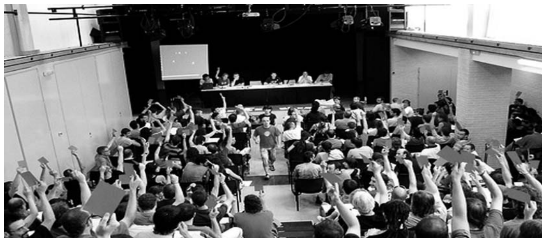
El foment de l'assemblearisme és bàsic per construir una alternativa popular contraposada als partits polítics convencionals

Redacció. La gran majoria d'entitats, col·lectius o associacions han fracassat en el seu intent de crear millores o alternatives al tipus de societat que ens ha tocat viure. El perquè l'hem de buscar en la confusió social a què ens aboca el nou liberalisme basat en xarxes neoburocràtiques i centralistes.