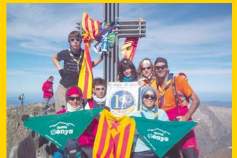
L'EROL, feliç, un cop al cim de la Pica d'estats

Esperem tenir relleus estables i seguir amb el dinamisme actual de l'agrupament.