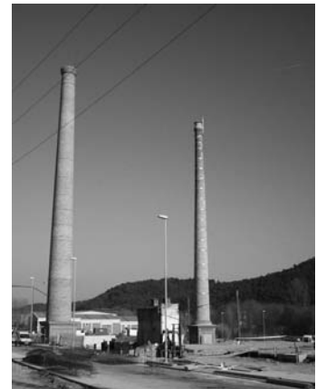
Les xemeneies de Can Pàmies, símbol del passat industrial de Sant Celoni

a conèixer amb entusiasme i rigor allò que ha modelat el que ara som, i que ens permetrà decidir amb major amplitud de mires cap a on volem anar, quin futur volem construir.