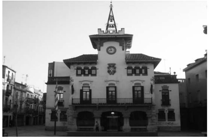
Des que la CUP ha entrat a l'Ajuntament està canviant la manera de fer política

En coherència amb el nostre internacionalisme, la CUP Sant Celoni va presentar i va aconseguir l'aprovació en el Ple de 27 de setembre del 2007 d'una moció de suport a Palestina i en contra de l'aïllament israelià de la franja de Gaza.