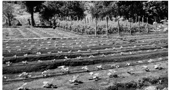
Horts municipals al carrer Consell de Cent de Barcelona