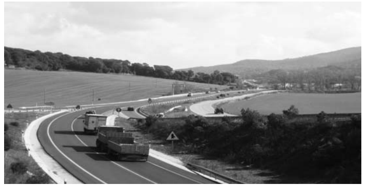
Punt d'enllaç de la variant de Cardedeu i Llinars amb la C-35

El 2006 es va aprovar el pla de revisió de carreteres i el govern tripartit va demanar la redacció d'un estudi sobre la viabilitat del projecte, l'anomenat pla Erce. Aquest informe constata que l'AP-7 i l'Eix transversal (que ara es desdoblirà per poder rebre més volum de trànsit) ja són les vies principals que suporten el trànsit que travessa Catalunya de nord a sud i d'est a oest i que, per tant, no cal que el Quart cinturó sigui tan llarg. D'aquesta manera es comença a manipular i a amagar el canvi de nom i l'escurçament aparent del projecte però no la seva magnitud ni la longitud. És a dir, el Quart cinturó ara ja no és Vilafranca del Penedès-Sant Celoni (amb el corresponent ramal Granollers-Mataró, que ja existeix), sinó que ara es proposa que sigui només Abrera-Granollers (el tram Abrera-Terrassa ja està en funcionament) i a partir d'aquí se li canvia el nom i es comença a parlar de l'autovia orbital de Vallès.