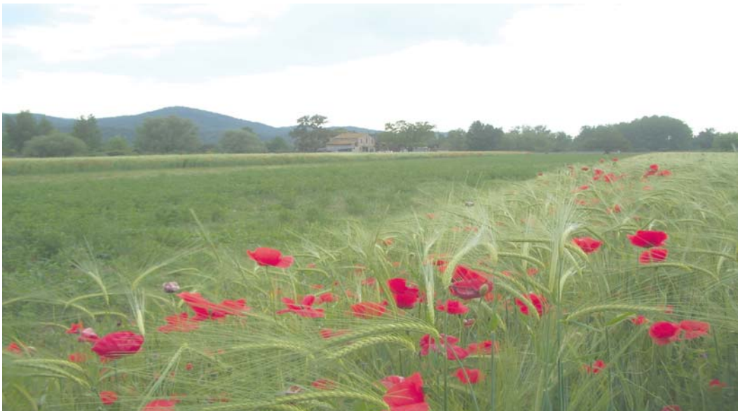
La Ferreria: una postal que pot desaparèixer

Volem salvar la Ferreria perquè hi creiem, perquè pensem que el futur està en la diversificació del sector econòmic i la potenciació dels espais agrícoles i dels valors naturals, perquè estimem el paisatge que ens envolta, perquè volem que els interessos del poble estiguin per sobre dels interessos privats d'aquells que sempre guanyen. En definitiva, perquè volem un Sant Celoni i una Batllòria millors i amb més qualitat de vida.