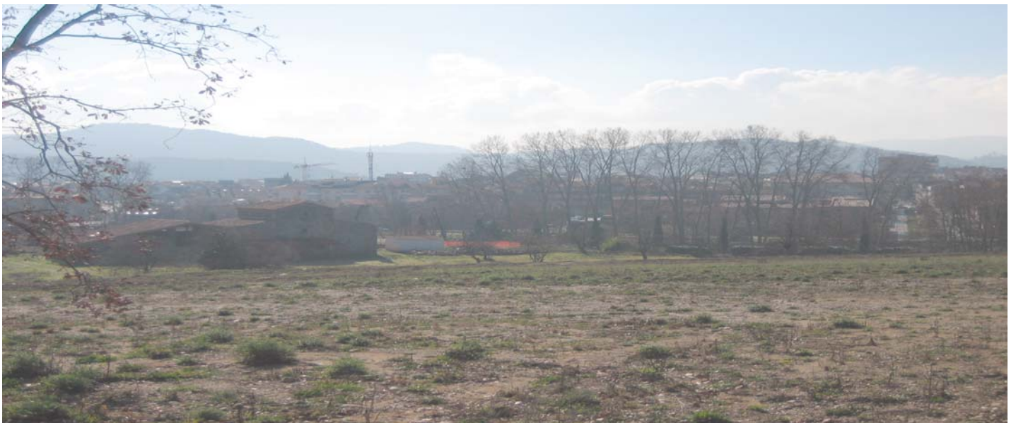
Can Riera de l'Aigua passarà a ser zona edificable en un tres i no-res

Estimació de creixement demogràfic i d'habitatges en els propers anys