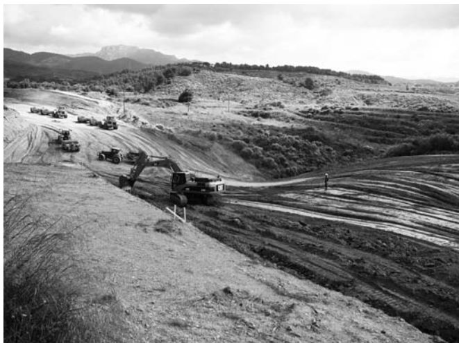
Obres del Quart Cinturó.

Les principals conseqüències de la ciutat difusa són: la depredació del sòl, un gran consum d'energia -a causa, en gran part, de la necessitat de desplaçar-se, que generalment es cobreix amb transport privat-, la imposició d'un model social basat en l'aïllament i en l'anonimat de les persones, una forta segregació social, una disminució de la qualitat de l'urbanisme i, finalment, un augment molt important dels costos de prestació dels serveis als ciutadans. És, per tant, un model caríssim des d'un punt de vista social, ambiental i econòmic, que, amb el temps, les administracions públiques podran assumir. La gran conurbació vindrà silenciosament i llavors sorgirà el problema de com regular l'ocupació industrial, residencial i urbana, és a dir, com controlar la complexitat i com gestionar-la. Només veient què ha passat a Londres o París sabem el que ens espera: la construcció de vies ràpides, l'aparició de centres comercials, magatzems, oficines, cines i altres entreteniments a les connexions entre autopistes. Tot plegat és tan complex que ja és