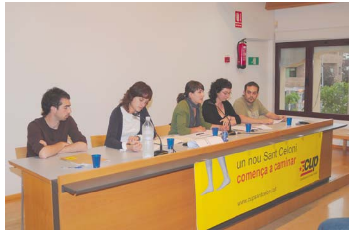
Dues imatges de la 7a Assemblea d'Unitat Popular de la CUP, celebrada el 17 de maig a la biblioteca l'Escorxador, en què es va decidir deixar sense efecte l'Acord d'investidura i governabilitat signat amb CiU el 2007 a causa del projecte d'ARE a Can Riera de l'Aigua.