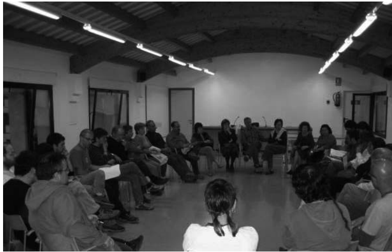
Imatge d'una de les tres reunions que la CUP va fer amb els veïns per informar del projecte d'ARE a Can Riera de l'Aigua.