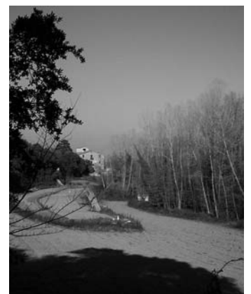
Els camps de Can Draper, un espai per conservar al peu del Montnegre.

En l'actual context de canvis accelerats, cal usar les noves eines per copsar les transformacions i, així, decidir cap a on es vol anar: la Geografia i les Ciències Ambientals hi tenen molt a dir.