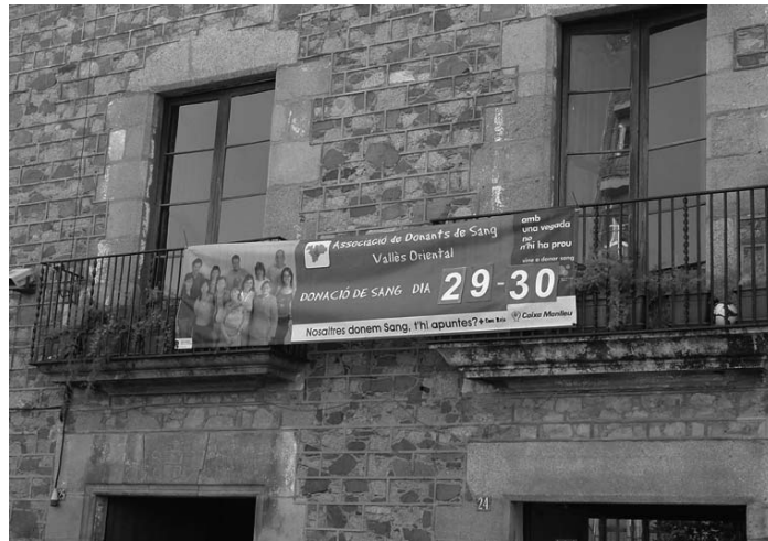
Pancarta de l'Ass. de Donants de Sang, a finals d'agost, al balcó de Can Ramis.

Des de la CUP considerem que la proposta d'ordenança municipal de publicitat no és res més que una cortina de fum rere la qual s'amaga la voluntat de controlar i escapar l'activitat dels moviments socials i el teixit associatiu del poble. Precisament, una riquesa que s'hauria de conservar i potenciar perquè és la garantia que assegura un poble cohesionat, crític i participi en la política municipal. Des de la CUP treballarem perquè es distingeixi entre publicitat privada i propaganda sense ànim de lucre, perquè la feina dels moviments socials del poble no quedi escapçada.