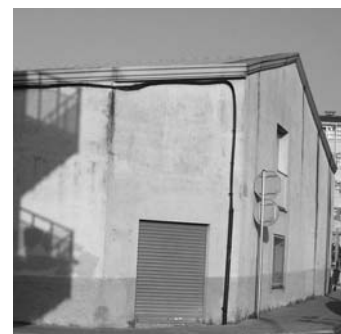
Local de l'Ass. de Veïns del Sax Sala.

Per sobre dels interessos electoralistes ha de primar la qualitat de vida dels veïns i veïnes de Sant Celoni, difícilment podem dissenyar el poble que volem si no convidem a participar, si no busquem les fórmules perquè tothom hi digui la seva i sigui escoltat. A la CUP creiem que els celonins i celonines de Sant Celoni "no passen" del que passa al seu municipi. Ara és el moment de demostrar que tothom té coses a dir i més quan es tracta del seu entorn més immediat.