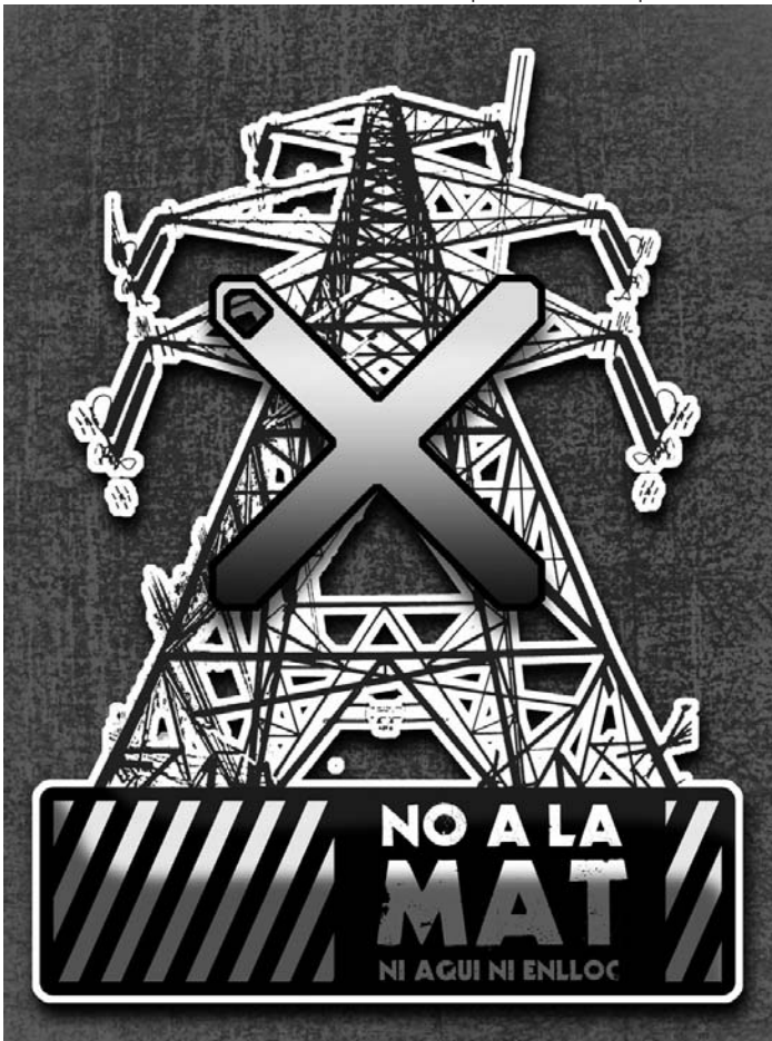
Cartell contrari a la MAT. Disseny: Jaume Turón.