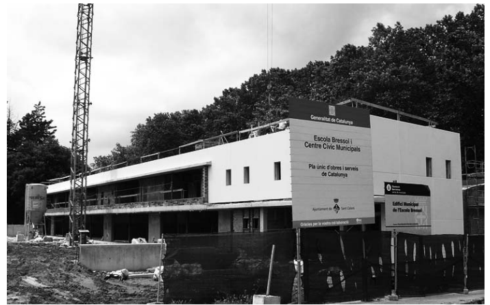
La futura escola bressol de Sant Celoni, en procés de construcció.

qualsevol cas restarem amatents i vigilants perquè l'escola bressol esdevingui un servei universal i d'altíssima qualitat. Un servei que no tan sols vetlli per l'educació dels menuts i dels seus pares i mares, sinó que, a la vegada, constitueixi una eina més per la igualtat d'oportunitats entre famílies, homes i dones. En definitiva, és a la recerca d'aquestes fites que hi podreu trobar la CUP.