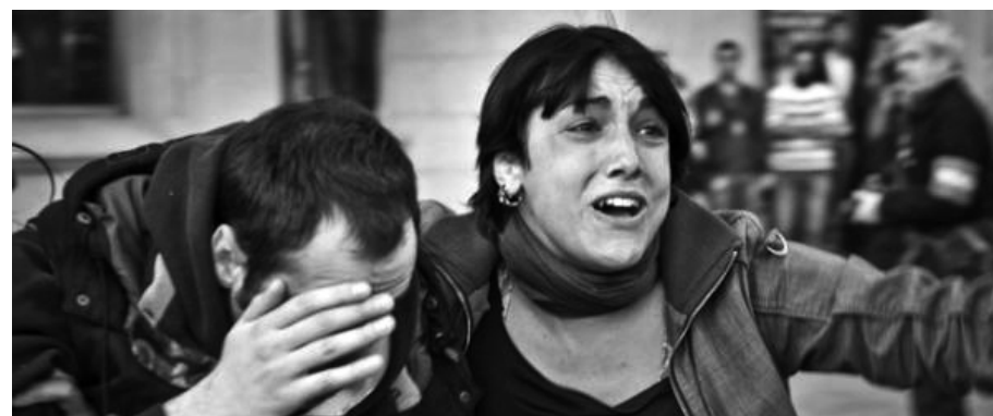
* Un dels manifestants que va perdre un ull a causa del llançament indiscriminat de pilotes de goma, moments després de ser disparat.

(2) Fragment del comunicat conjunt de la Comissió de Defensa del Col·legi d'Advocats de Barcelona, la Comissió de Drets Humans del Col·legi d'Advocats de Girona, l'Observatori dels Drets Econòmics Socials i Culturals de Barcelona (DESC), la Federació d'Associacions de Veïns de Barcelona (FAVB), l'Observatori dels Sistemes Penals de la Universitat de Barcelona i l'Associació Catalana de Defensa dels Drets Humans (ACDDH) amb motiu de l'empresonament de manifestants el dia de vaga general.